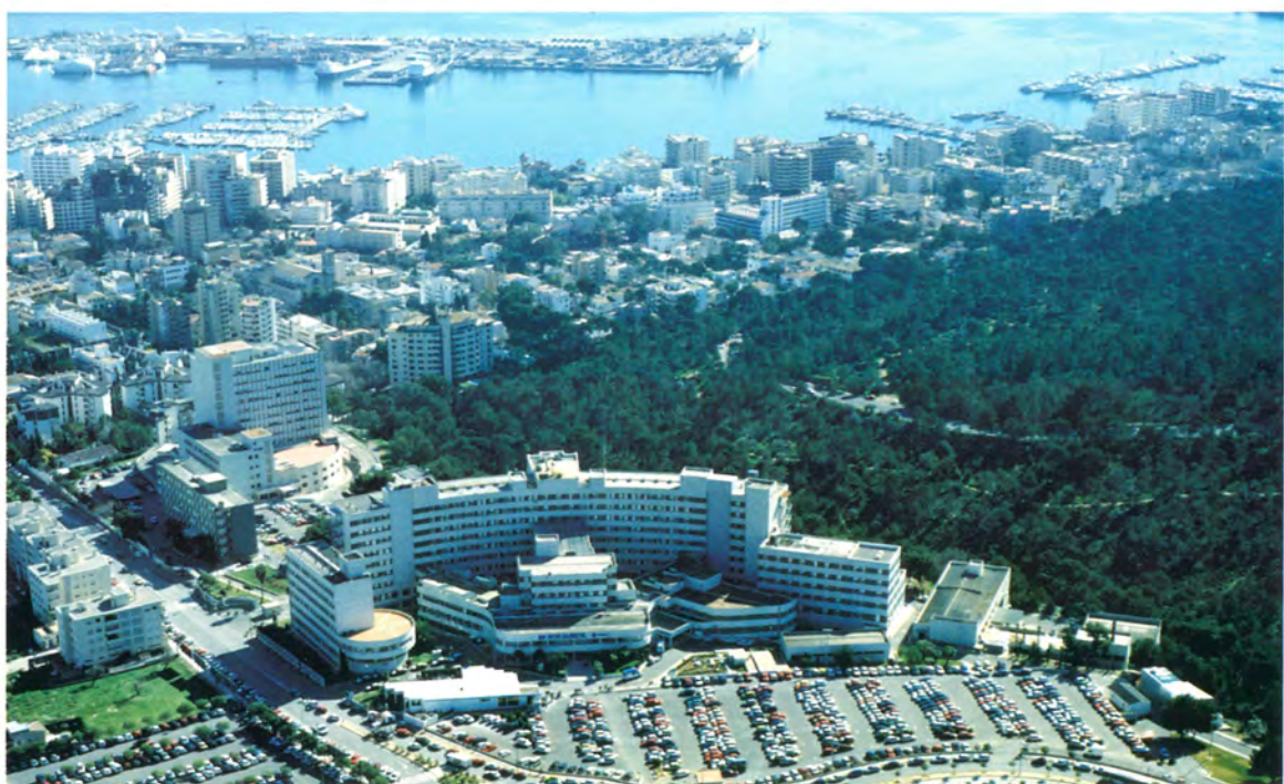
Fig. 10. Vista aérea Norte.