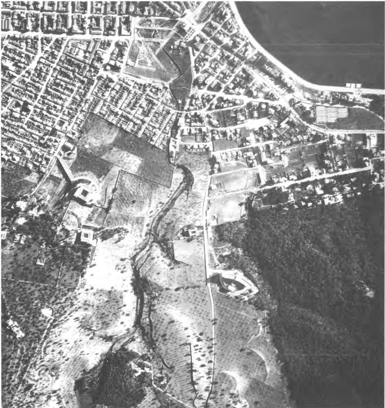
Fig. 1. Vista aérea de la zona denominada “Son Dureta”

Los terrenos elegidos para la edificación de la Residencia Sanitaria de la Seguridad Social de Palma de Mallorca eran los de una finca denominada “Son Dureta”