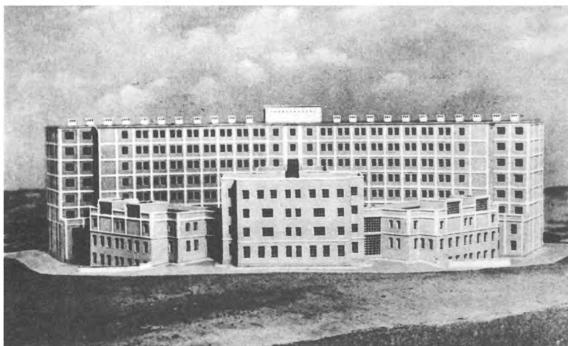
V. PALMA DE MALLORCA.— Fachada posterior de la Residencia Sanitaria de 300 camas.