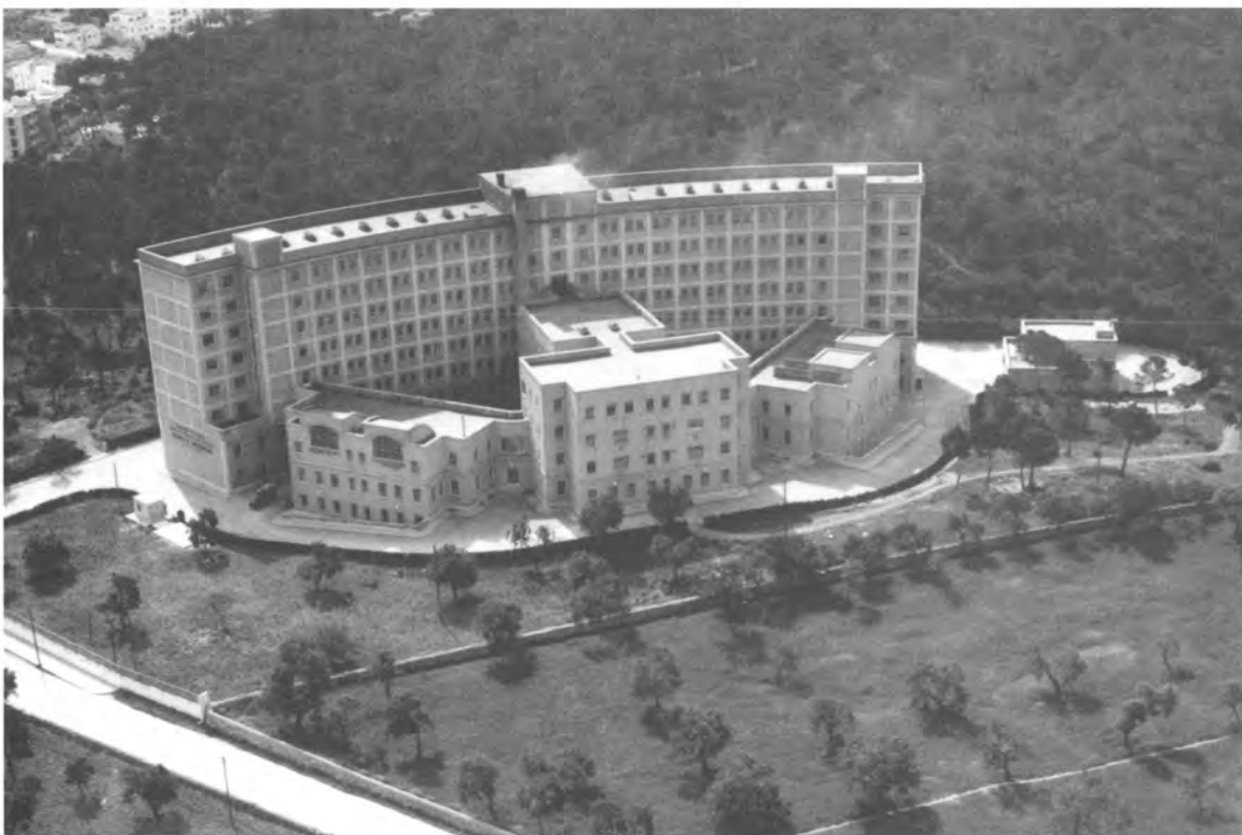
Fig. 5. Vista aérea de la fachada Norte.