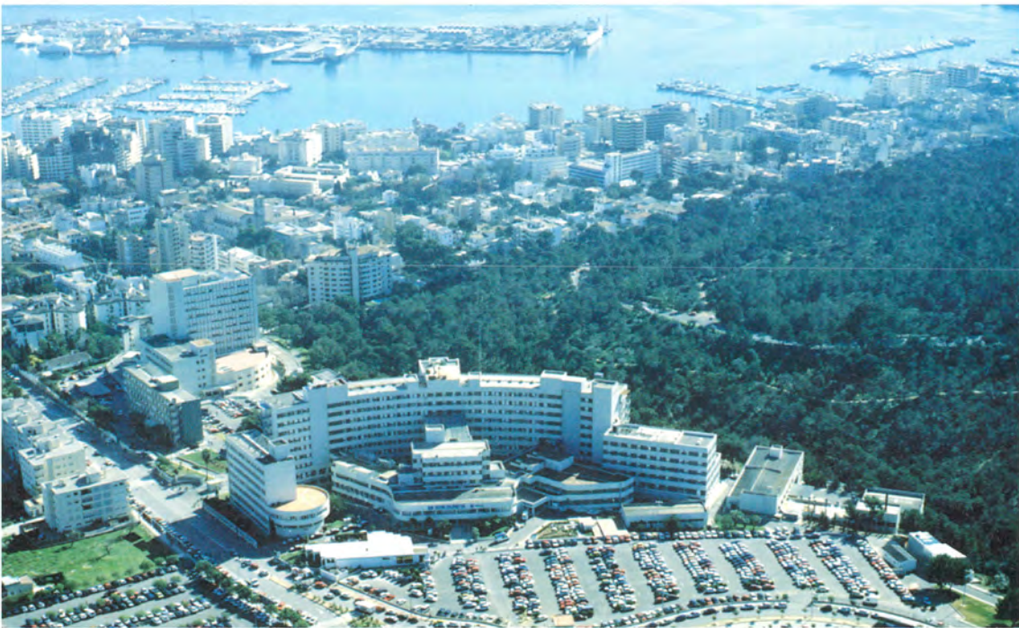
Fig. 8. Vista aérea Norte Noreste