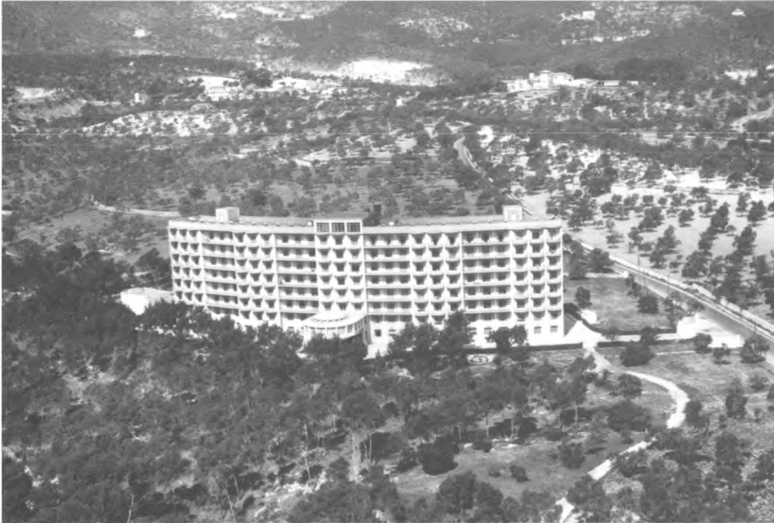
Fig. 4. Vista aérea de la fachada Sur.