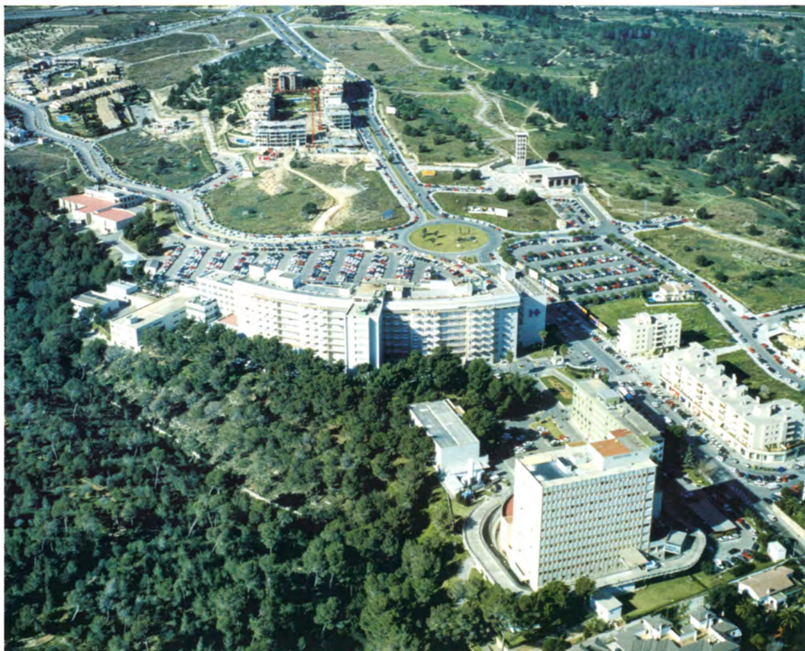
Fig. 9. Vista aérea Sur