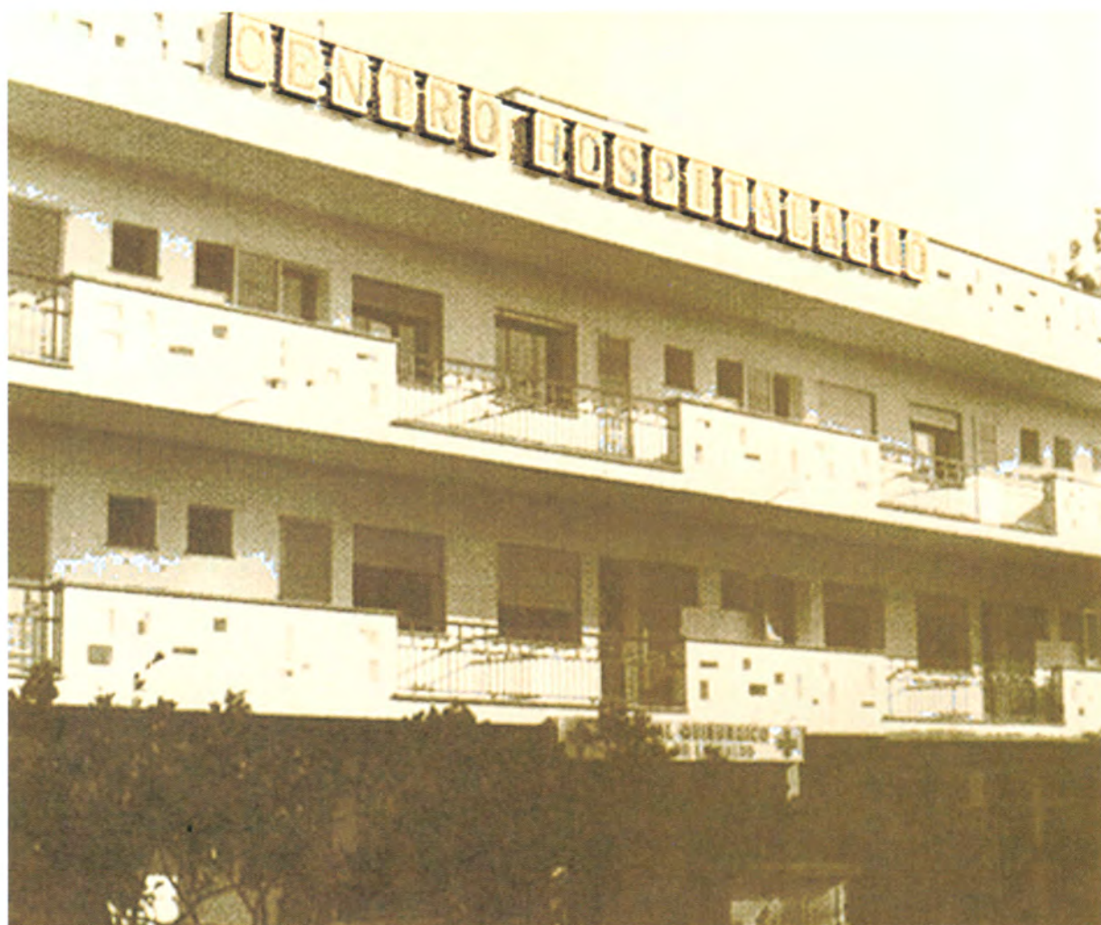
Fig. 6. Fotografía de la fachada principal de la “Clínica Virgen de la Salud” cuando su incorporación al Complejo Sanitario Residencia Sanitaria Virgen de Lluçh. Se hallaba en el número 31 de la Calle Jazmín de El Vivero de Palma de Mallorca

En 1976 se incorpora el edificio “C” a la Residencia Sanitaria Virgen de Lluçh.