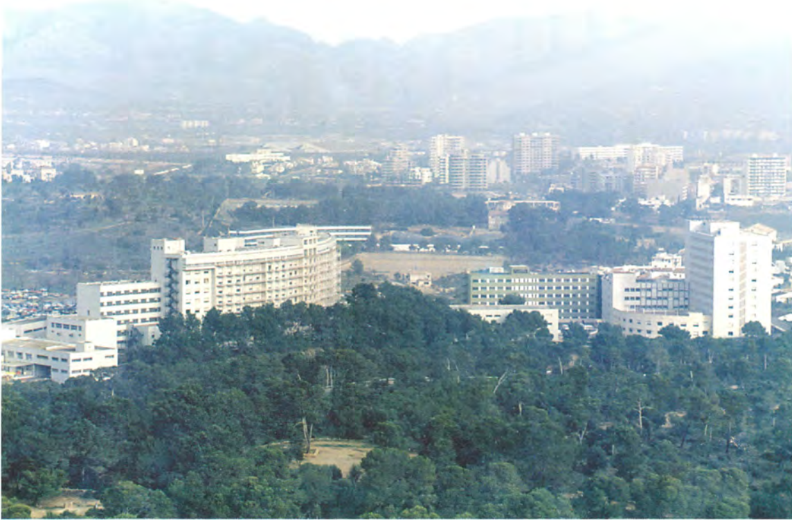
Fig. 7. Vista aérea Sur Suroeste.