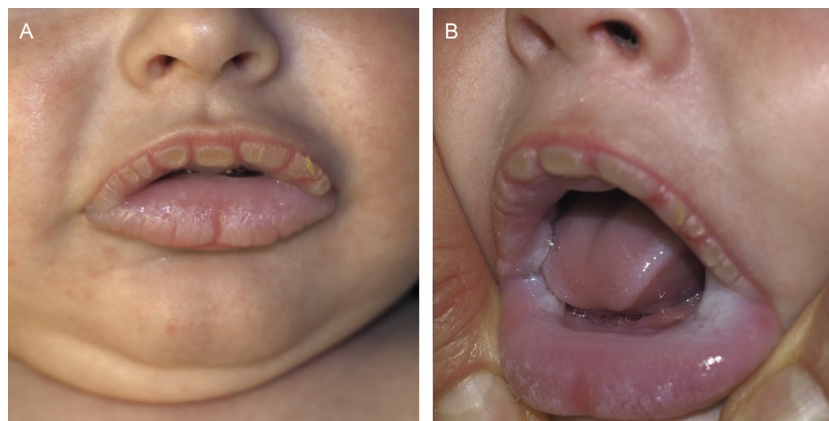
Figura 1 Placas blanco-amarillentas hiperqueratósicas que afectan la totalidad de la mucosa labial externa (A). Placas blanquecinas bilaterales y simétricas, de aspecto aterciopelado, en la mucosa yugal, labial interna y lingual lateral (B).

La localización más frecuente es la mucosa yugal, seguida de otras partes de la mucosa oral o labial, pero también puede afectarse el esófago, el tracto respiratorio, el recto o los genitales. Clínicamente, se presenta como unas placas blanquecinas engrosadas, bilaterales y simétricas, con una superficie aterciopelada y que no desaparecen con la fricción 2,5 . En la histología, es característica la presencia de acantosis, hiperparaqueratosis, la vacuolización de los queratinocitos en los estratos suprabasales y, en ocasiones, se hallan unos depósitos eosinófilos perinucleares de tonofilamentos de citoqueratina.