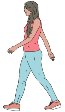
Vida activa Evitar los ejercicios de impacto