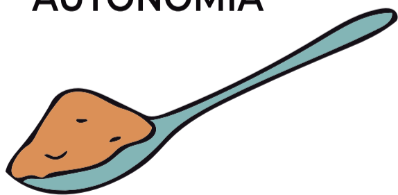
Blanda / Puré